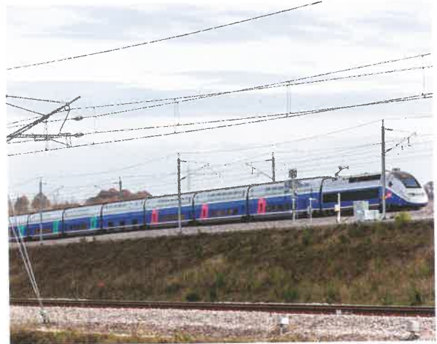
ESVE, a key overspeed test risk management factor