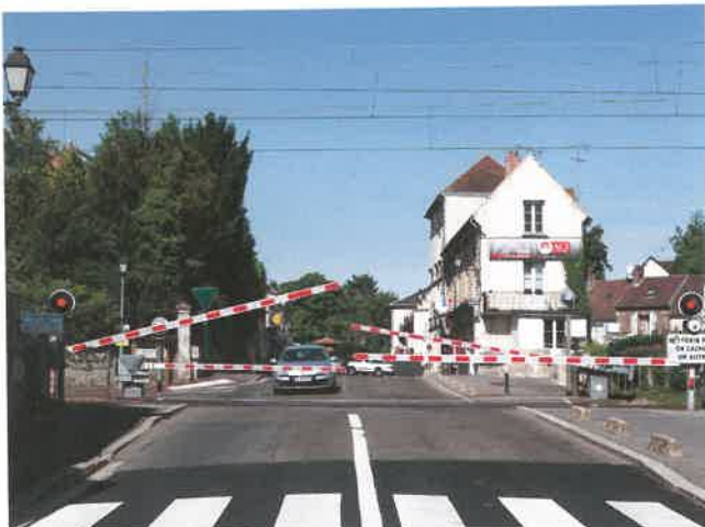
The MORIPAN project (Level crossing risk model)

OLIVIER CAZIER, CI LIANG, MOHAMED GHAZEL