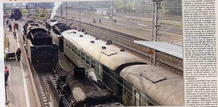
Detrás de los 15, 16 y 17 de septiembre, los aficionados de MÄRKLIN, TÖL, CÖR y del tren en general, tuvieron una importante cita en Göppingen, en el Estado de Baden-Württemberg (Alemania).