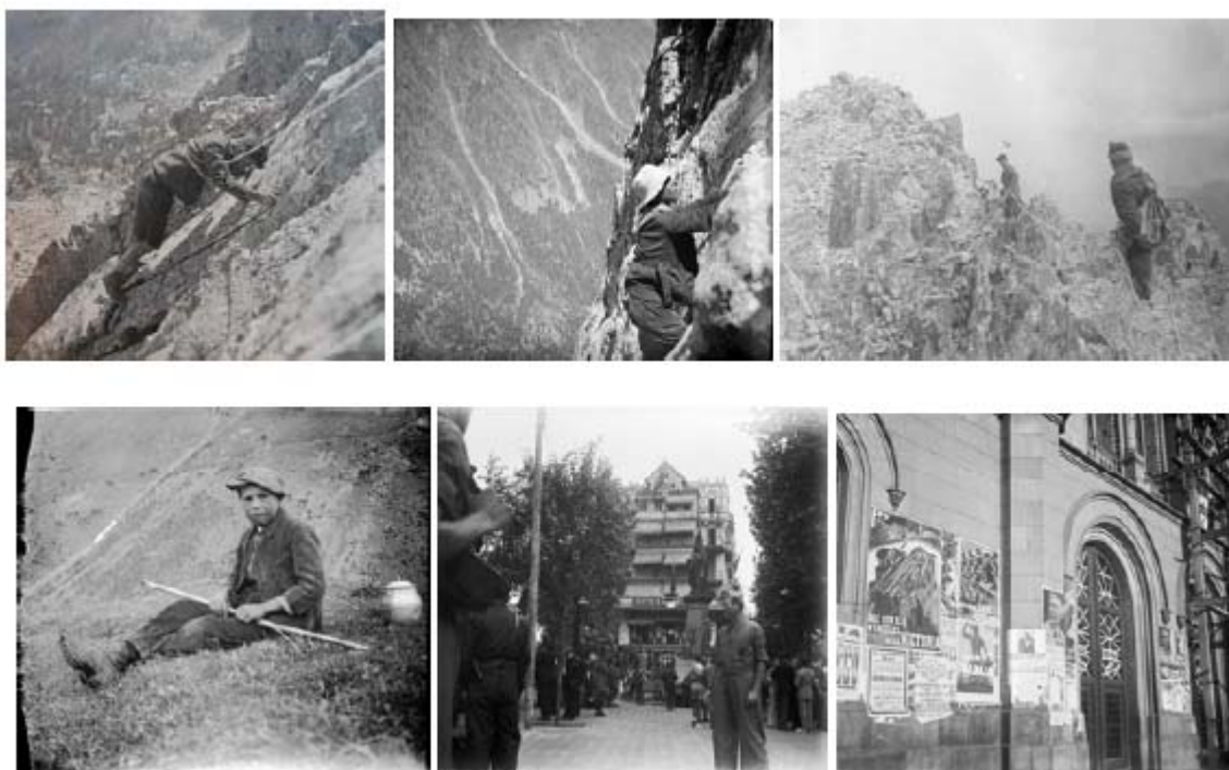
Fig. 3

El archivo histórico del CEC también custodia diversos documentos del fondo de Lluís Estasen 37 . Una serie de 17 artículos mecanoscritos con correcciones y anotaciones manuscritas que en algunos casos constituyen el borrador para publicaciones en el Butlletí del Centre Excursionista de Catalunya y en otras el guión para conferencias que acompañaba con unas proyecciones.