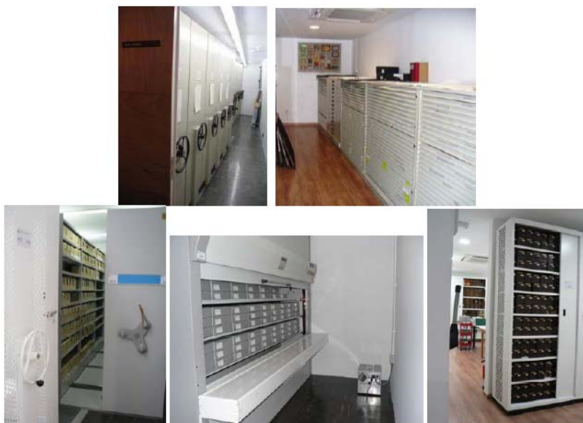
Fig.1 Depósitos del Archivo Histórico del CEC (parte superior). Depósitos del Archivo Fotográfico del CEC (parte inferior).